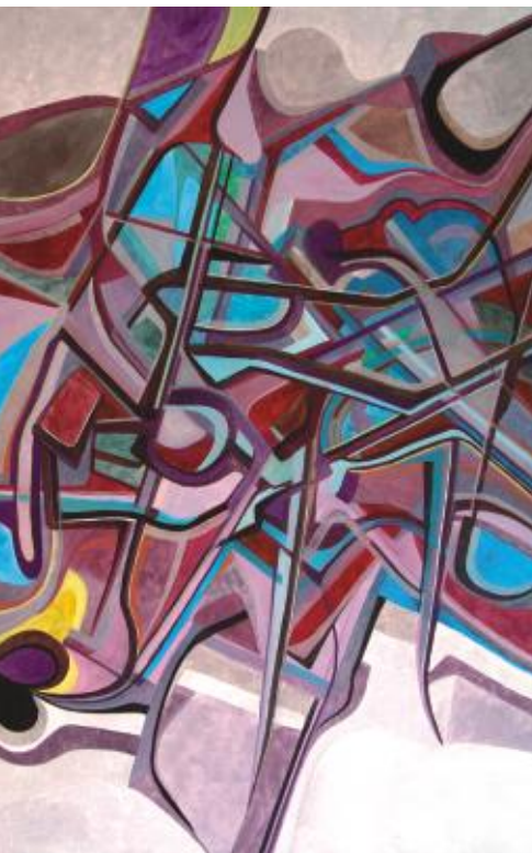
SEM TÍTULO código 0382004 óleo sobre tela 170 x 110 cm 2004