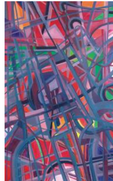
SEM TÍTULO código 0352004 acrílico e óleo sobre tela 130 x 80 cm 2004