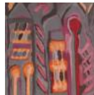
SEM TÍTULO código 0122005 óleo sobre tela 40 x 40 cm 2005